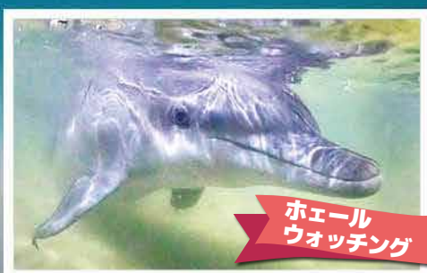
ホエール ウォッチング