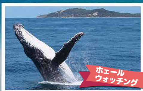
ホエール ウォッチング