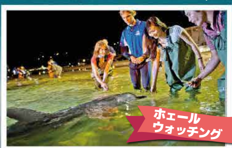
ホエール ウォッチング